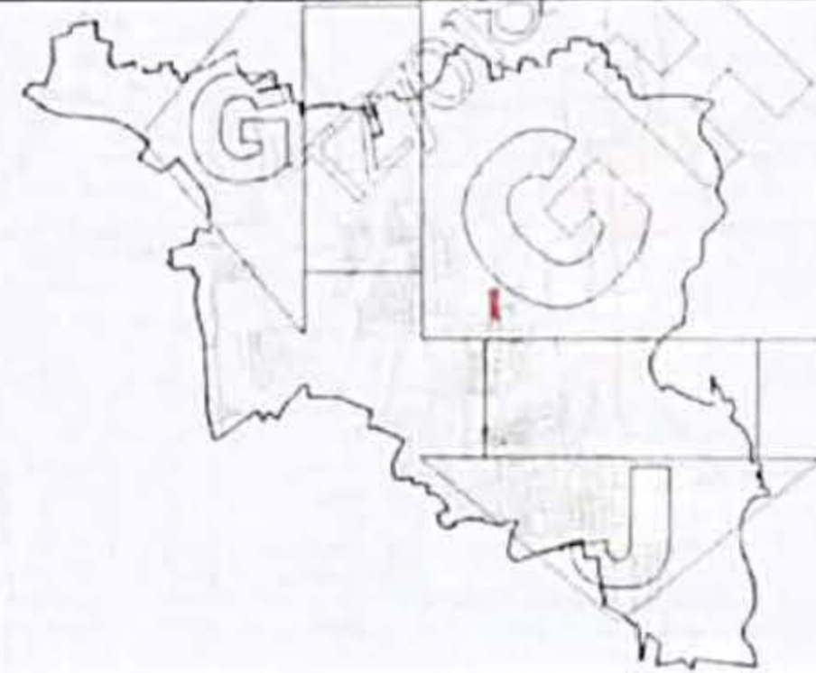
地块规划控制指标表