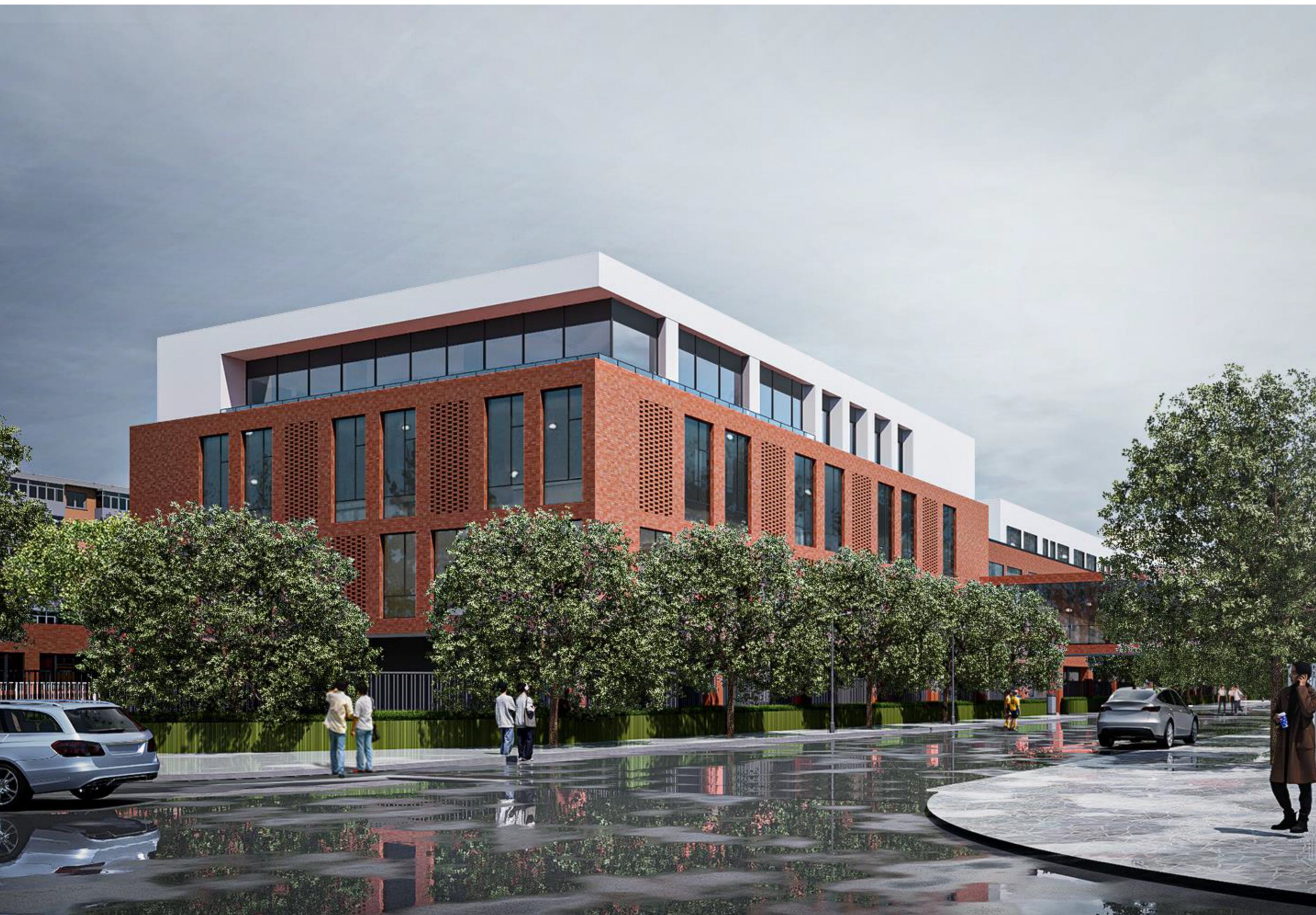
菜市口大街辅路视角效果图

本案充分考虑新建项目与周边住宅的关系: 建筑间距满足国家及北京市地方规范的相关要求。经日照分析软件测算, 方案实施后周边现状日照情况符合国家有关日照标准。