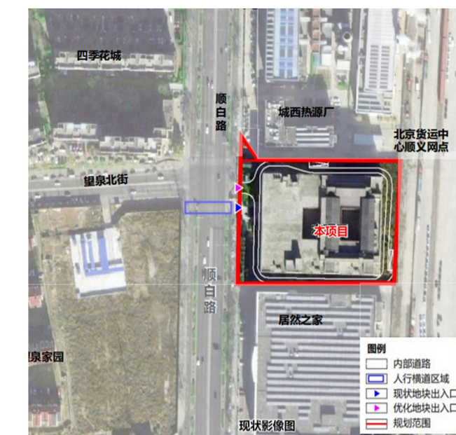
工程区现状影像图