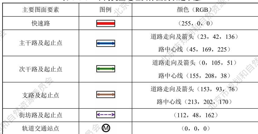
表 C.0.6 不同类型地理实体图例表达示意

C.0.6 地名规划图应以不同颜色或不同粗细线条区分不同类型或级别的地理实体。以线条粗细区分各级规划道路时，应依次为快速路、主干路、次干路、支路、街坊路（可根据国土空间规划的深度要求表达达到不同道路等级）。不同类型地理实体图例表达宜符合表 C.0.6 的要求。