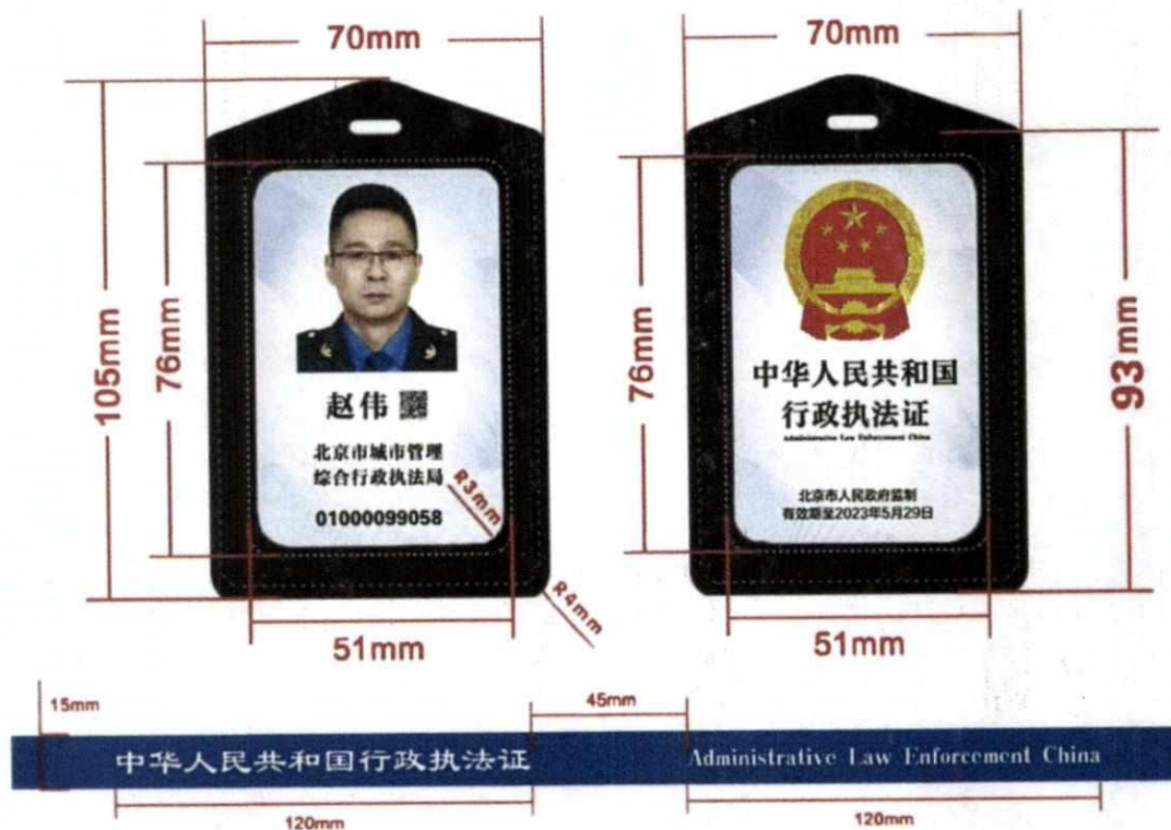
图 6：佩戴式卡套各要素坐标及尺寸