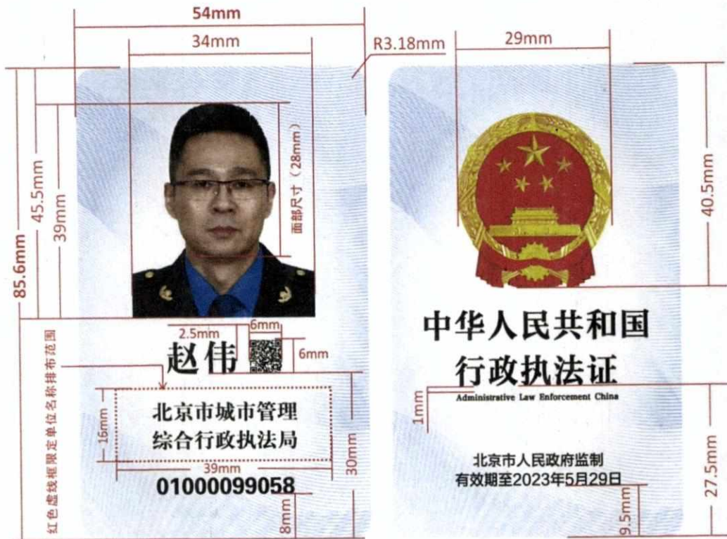
图 4：识别卡各要素坐标及尺寸